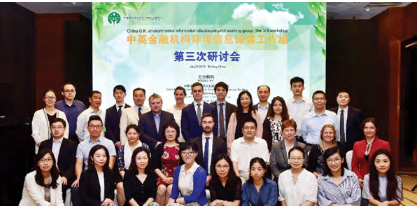
上图：试点研讨会于2018年7月23日在北京召开