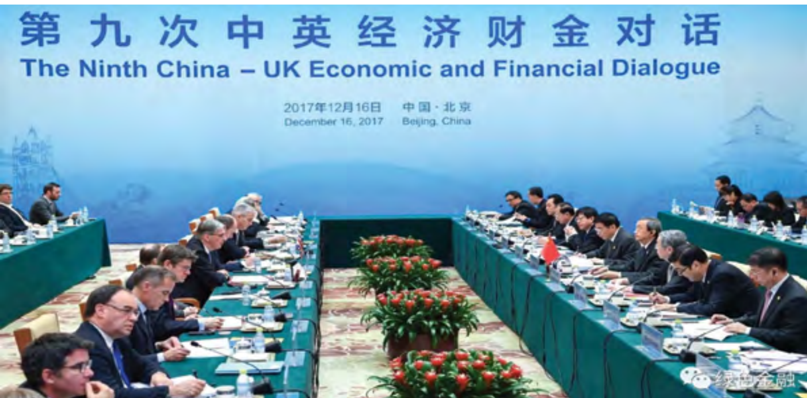
上图：试点于2017年12月16日第九次中英经济财金对话会上宣布启动